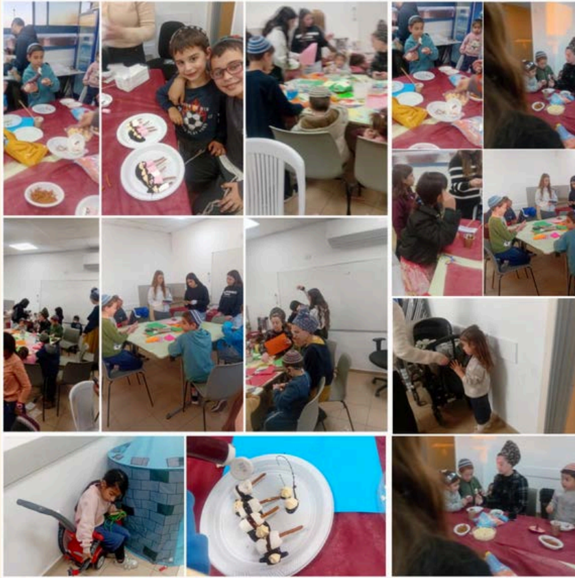
שכבת י' ממשיכה בהתנדבות של ילדי המגוייסיים בהר חומה