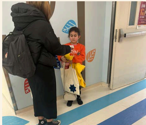
כיתה יא 1 בהתנדבות בשערי צדק ומחלקת ערכות לפצועי המלחמה במחלקת השיקום בהר הצופים